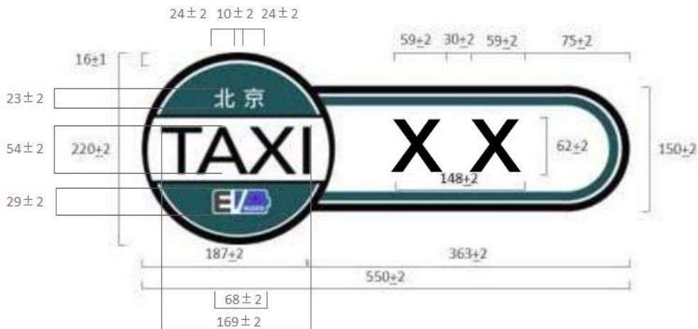
图A.2 纯电动出租小客车车身标识示例(右侧门饰)