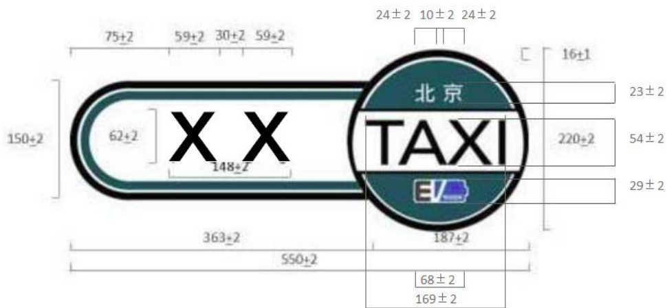
图A.1 纯电动出租小客车车身标识示例(左侧门饰)

车身标识示例图中图片大小的长度单位为毫米(mm)；字体为黑体 Bold；颜色为：白 C:0 M:0 Y:0 K:0，黑 C:93 M:88 Y:89 K:80。